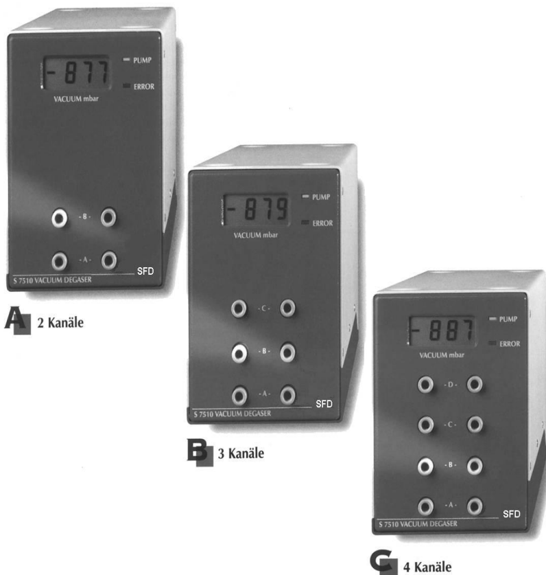
A 2 Kanäle